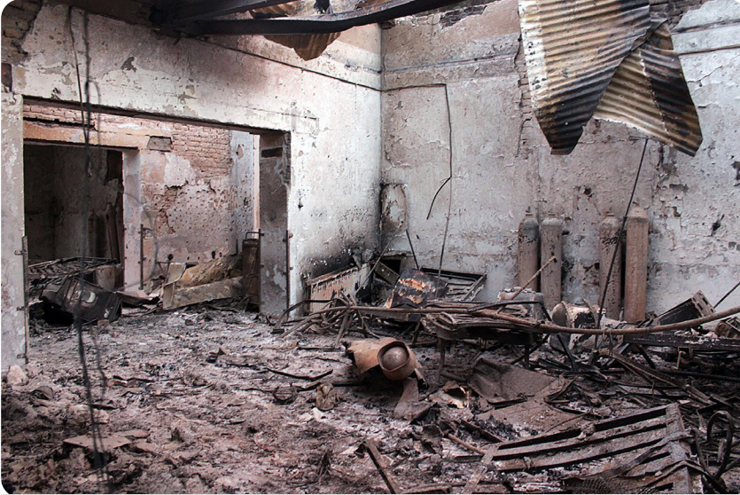
صورة أرشيفية: قصف الاحتلال لمدينة قندوز طال مستشفى أطباء بلا حدود