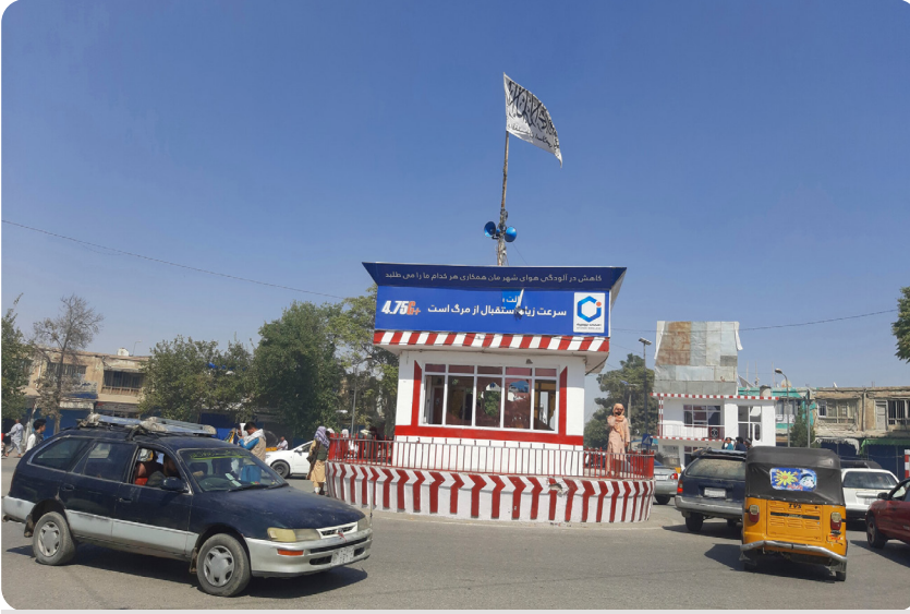
صورة أرشيفية لمركز مدينة قندوز